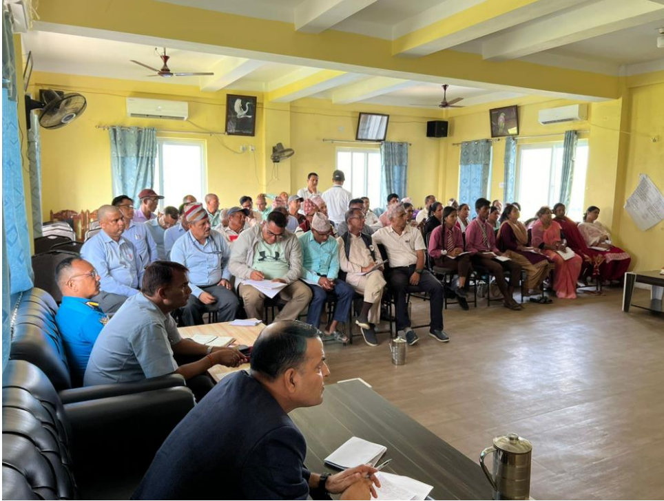
कार्यक्रमका सहभागीहरु ।